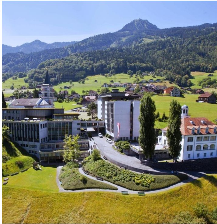
Un regard sur le Centre Neu-Schönstatt