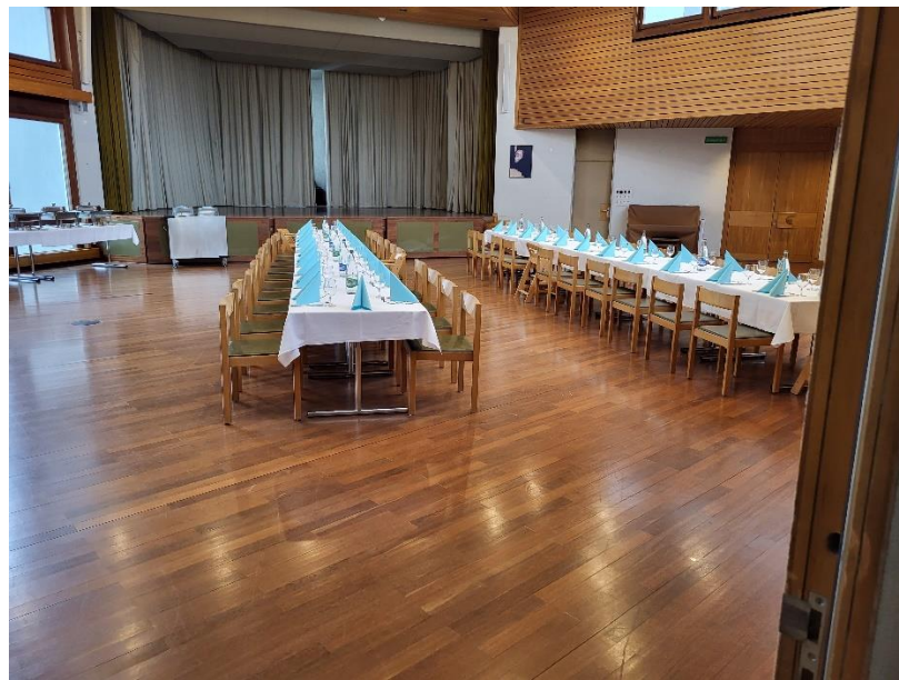
Salle de travail (ici encore disposée pour le banquet)