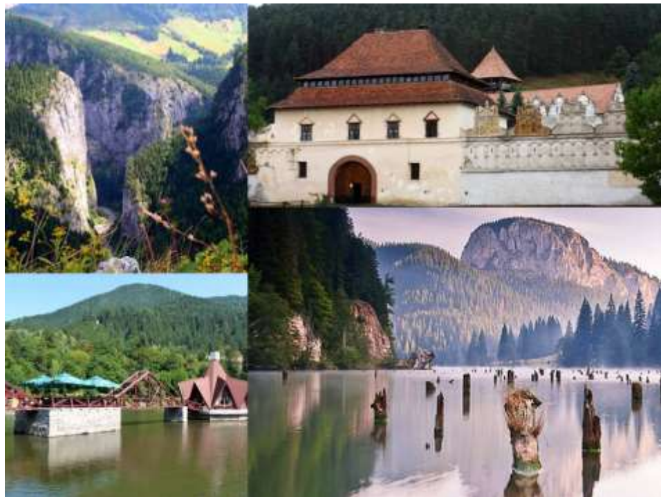
Les Gorges de Bicz/ Békás, Le chateau de Lázarea/Gyergyószárhegy) et Le Lac tueur (Lacul Roșu/Gyilkos-tó)